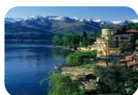
Lago di Como