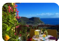
Lago di Garda